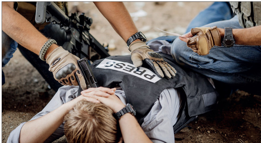
In zehn Jahren 695 Journalisten getötet.

2015 waren mindestens 101 Medienschaffende wegen ihrer Arbeit getötet worden, darunter 67 professionelle Journalisten. Der deutliche Rückgang in diesem Jahr ist jedoch kein Anlass zur Entwarnung: Er erklärt sich vor allem dadurch, dass aus einigen Ländern viele Journalisten geflohen sind, weil die Fortsetzung ihrer Arbeit dort zu gefährlich gewesen wäre. Dies gilt insbesondere für Syrien, den Irak, Libyen, den Jemen, Afghanistan und Burundi. Damit fehlen gerade aus Ländern mit akuten politischen Konflikten unabhängige Informationen, die es auch der Weltöffentlichkeit ermöglichen würden, sich ein verlässliches Bild von der Lage dort zu machen.